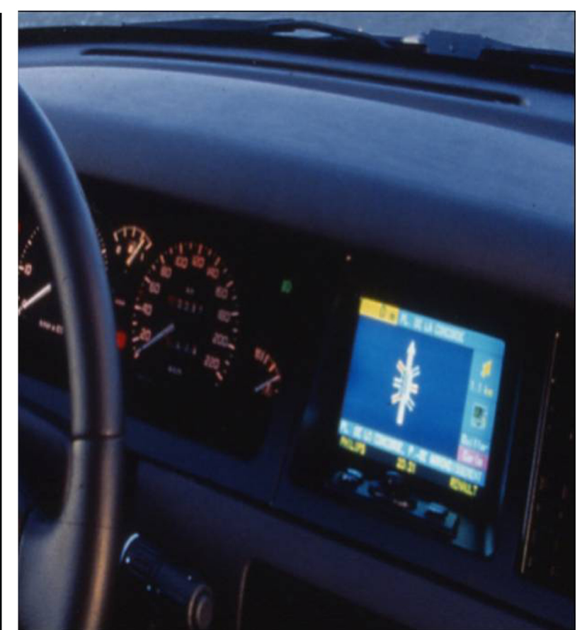
Terminal intégré Renault Safrane