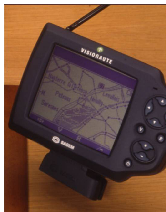
Terminal Autonome T2000